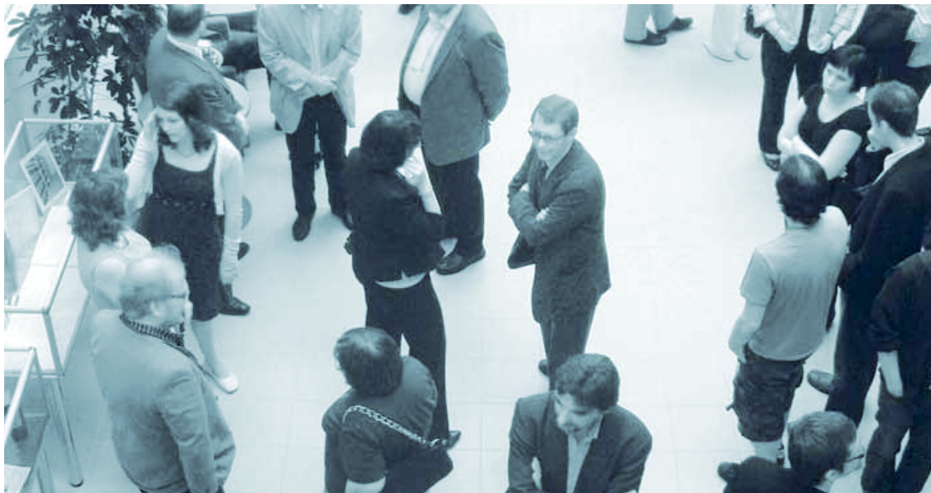
Arkivdagarna ordnas vart fjärde år.