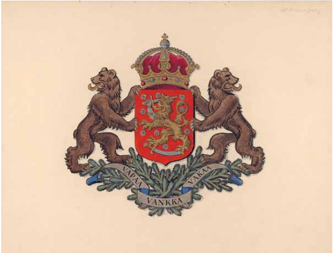
Ett förslag till Finlands stora riksvapen från 1936, ritat av Germund Paaer.