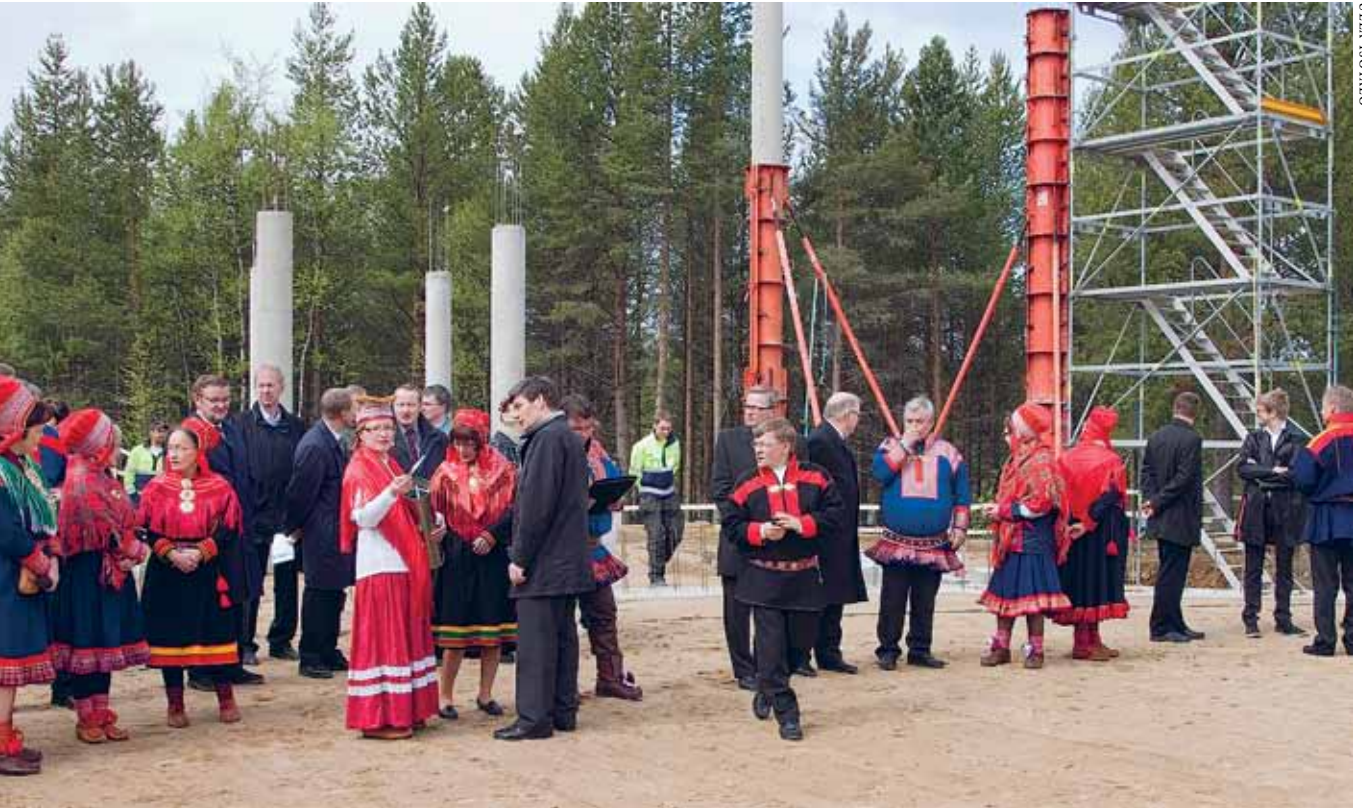
Grundstenen till samekulturcentret Sajos murades 10.6.2010 i Enare.